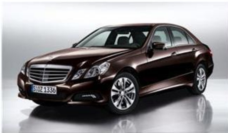
Mercedes-Benz E-Class 200 NGT