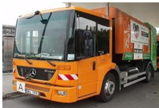
Mercedes-Benz Econic 1828 NGT