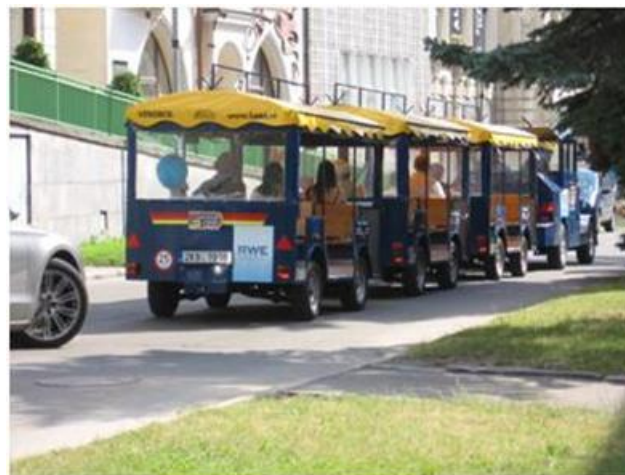
1. CNG vláček Karlovy Vary