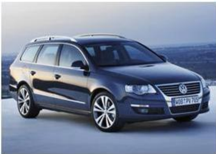
Volkswagen Passat 1.4 TSI EcoFuel Limousine / Variant