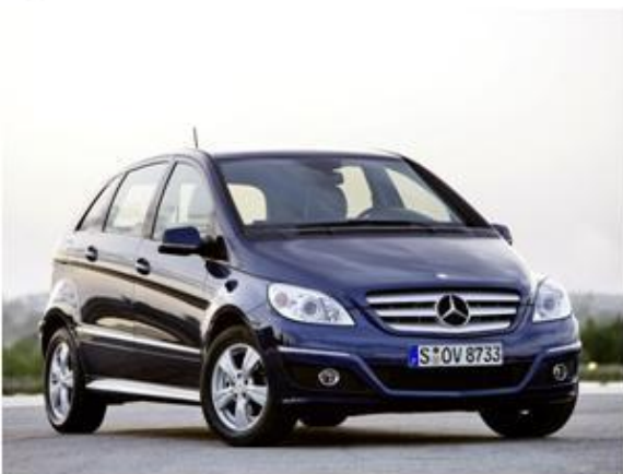
Mercedes-Benz B-Class 180 NGT