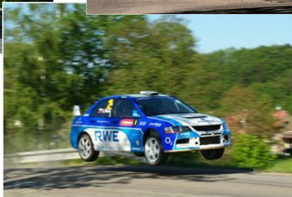
Mitsubishi Lancer EVO IX CNG