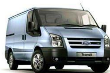
Ford Tranzit 2.3 I – Duratec – DOHC CNG