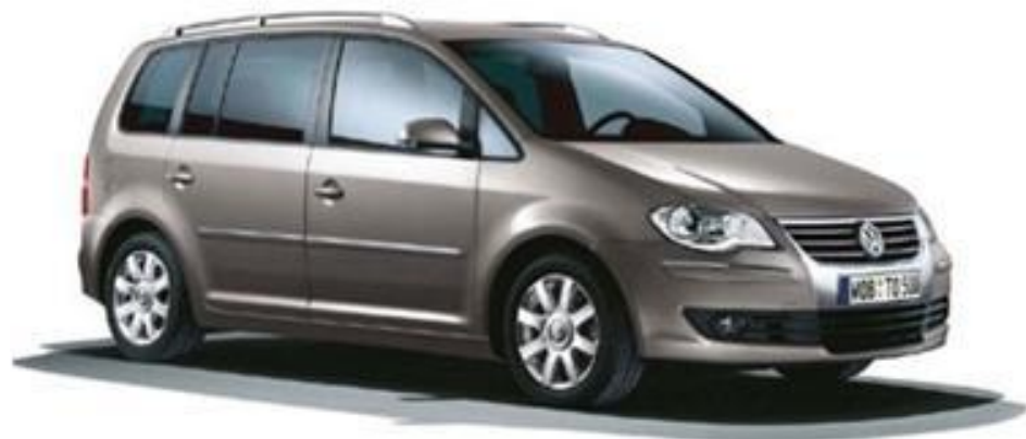
Volkswagen Touran 1.4 TSI EcoFuel