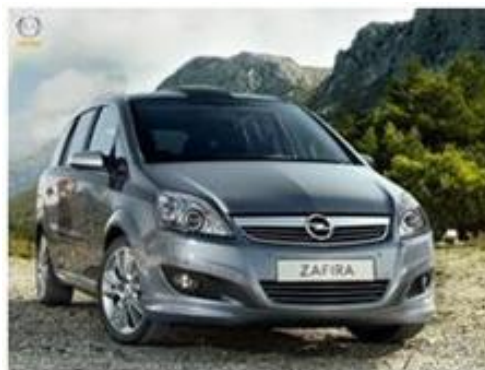
Opel Zafira 1.6 CNG EcoTec