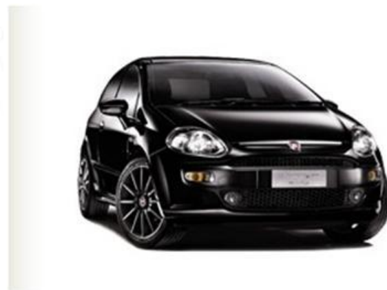
Fiat Punto Evo Natural Power